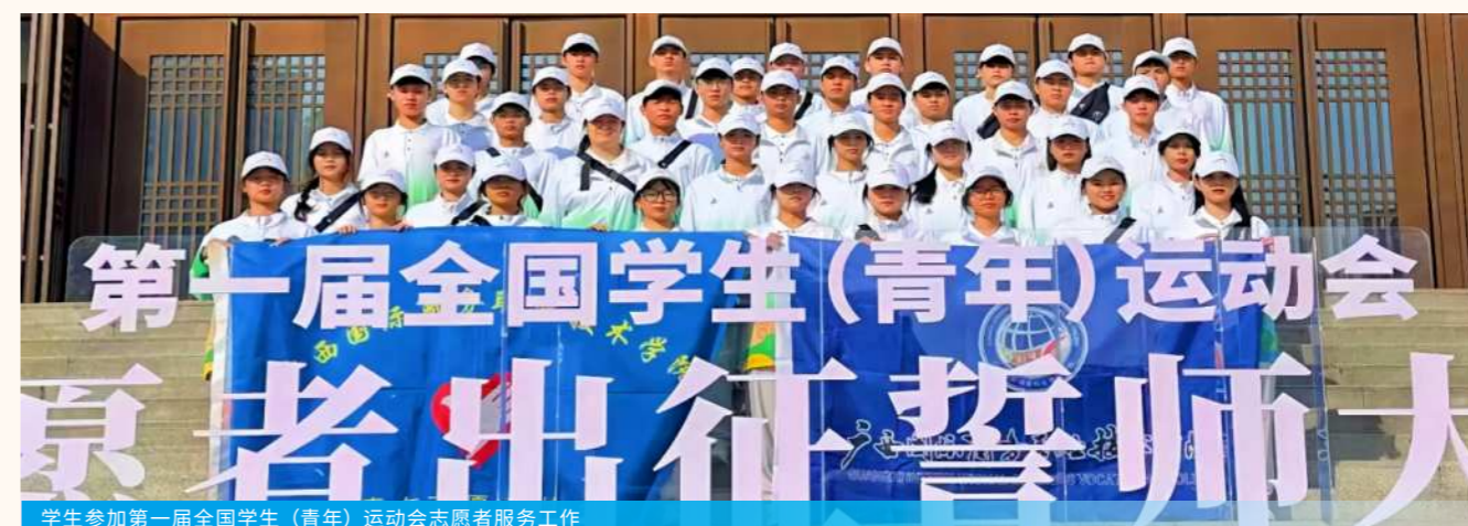
学生参加第一届全国学生（青年）运动会志愿者服务工作