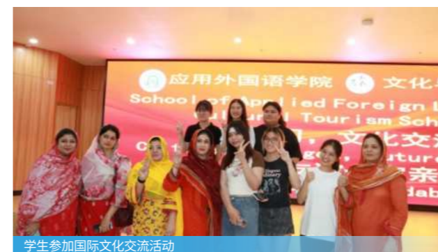
学生参加国际文化交流活动

主要面向涉外商贸服务行业，可担任商务助理、行政助理、跨境电商运营专员、翻译及涉外文秘等。