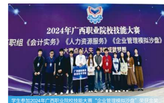
学生参加2024年广西职业院校技能大赛“企业管理模拟沙盘”荣获金奖