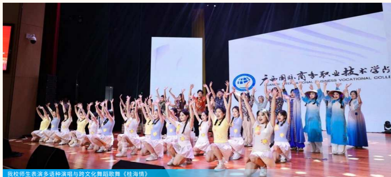
我校师生表演多语种演唱与跨文化舞蹈歌舞《桂海情》

为深入贯彻落实“三全育人”教育理念,全面促进学生德智体美劳五育并举、协同发展,学校以“以德铸魂、以智启慧、以体强身、以美育人、以劳筑基”为抓手,精心组织系列活动,引导广大学生在实践体验中锤炼品格、增长才干,切实提升综合素养。