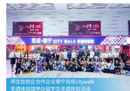
师生在校企合作企业南宁双成citywalk非遗体验馆举办留学生非遗体验活动