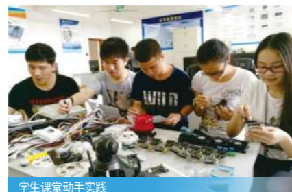
学生课堂动手实践