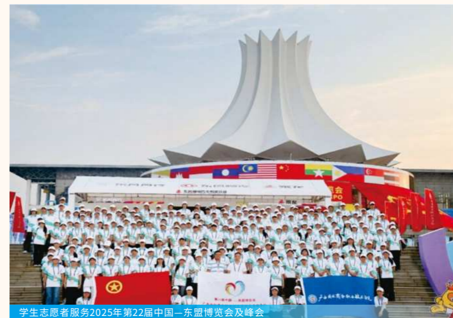
学生志愿者服务2025年第22届中国—东盟博览会及峰会

我校206名共青团员、学生志愿者以饱满的热情和专业的服务精神，圆满完成2025年第22届中国—东盟博览会及峰会志愿服务工作，为盛会的顺利举办贡献了青春力量。