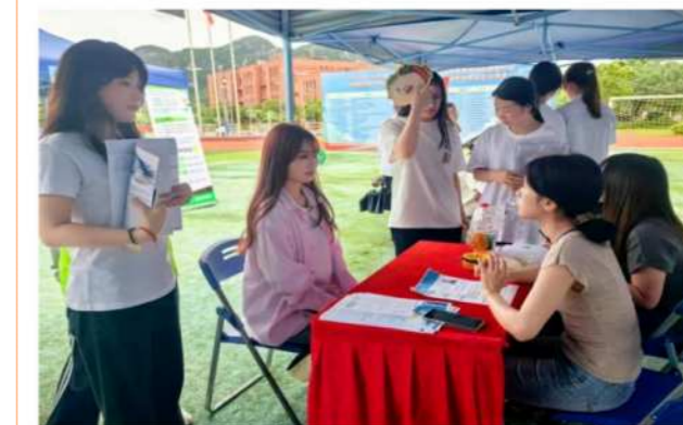
↑ 毕业生与用人企业现场交流

6月14日，广西国际商务职业技术学院在东盟校区举办2025年“火热青春·就在南宁”高校毕业生校园“双选会”，130余家用人单位面向学校9607名毕业生提供24000个就业岗位，构建校企人才对接高效平台。