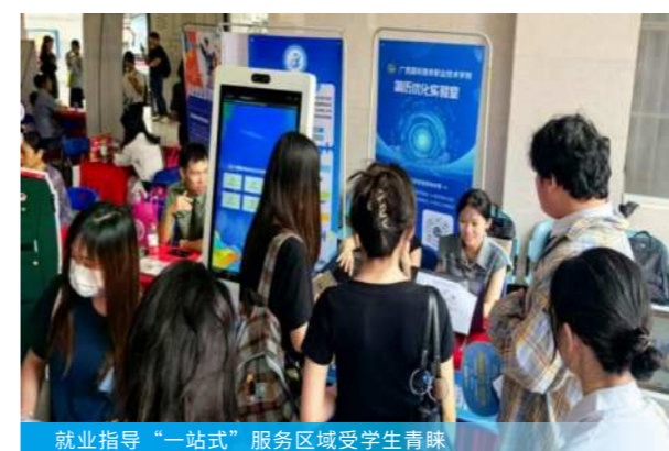
就业指导“一站式”服务区域受学生青睐