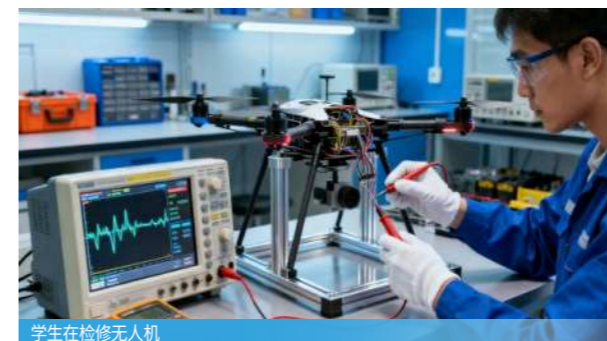
学生在检修无人机

无人机装配调试、无人机飞行操控、无人机售前售后技术服务、无人机行业应用、无人机检测维护等。