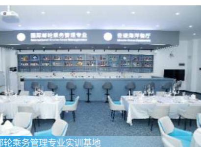
国际邮轮乘务管理专业实训基地