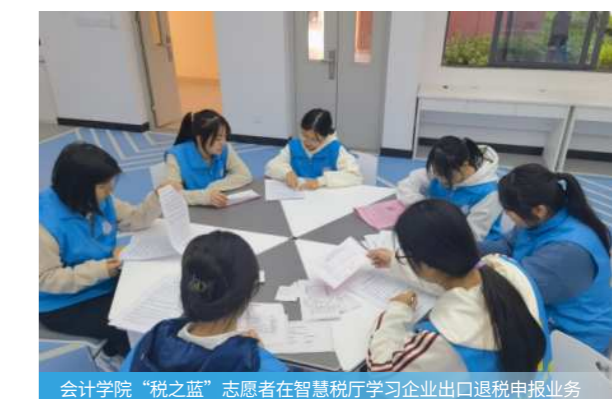
会计学院“税之蓝”志愿者在智慧税厅学习企业出口退税申报业务