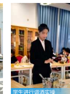
学生进行调酒实操