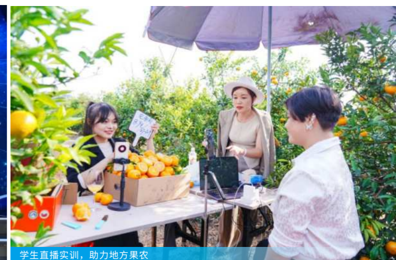
学生直播实训，助力地方果农