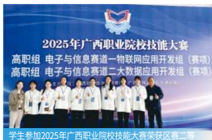
学生参加2025年广西职业院校技能大赛荣获赛区二等奖

本专业为自治区教育厅现场工程师项目实施专业，引入华为相关考证，设立独立物联网工作室，为学生优质就业及科研创新提供有力支撑。在课程体系构建上，以系统化培养为核心，全面覆盖物联网领域硬件开发、软件开发等关键知识模块，助力学生构建完整的专业知识框架。对于专业能力突出的学生，可进入物联网工作室，深度参与企业真实项目的全流程开发，在实践中提前积淀行业实战经验，为后续职业发展筑牢核心竞争力基础。