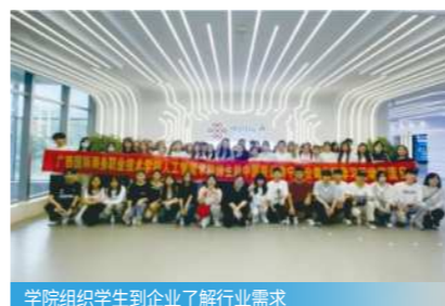
学院组织学生到企业了解行业需求

在机关事业单位、金融机构、科技企业负责漏洞挖掘、安全防护系统搭建、数据合规审计等工作，契合数字时代安全防护刚需。担任网络安全工程师、渗透测试工程师、安全架构师等。