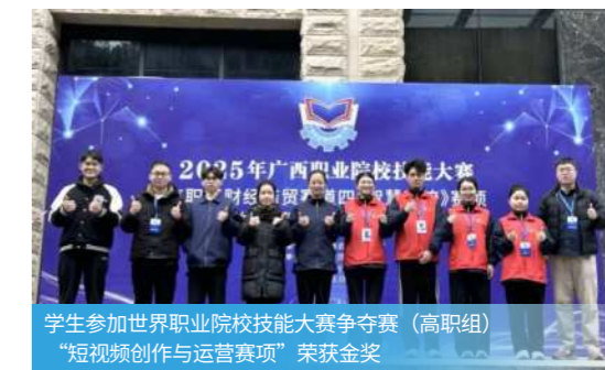
学生参加世界职业院校技能大赛争夺赛（高职组）“短视频创作与运营赛项”荣获金奖

智慧仓储规划与设计、物流大数据分析、物流系统运营管理、物流项目规划建设；采购专员、仓储物流专员、物流运输专员、运营管理师等。