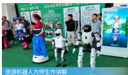
旅游机器人为师生作讲解

在旅行社、旅游景区、酒店业、餐饮业、休闲企业、旅游交通行业、文博馆、旅游行政管理部门等从事智慧旅游系统运营、智慧化设备操作、旅游电子商务技术、旅游产品策划与设计、旅游新媒体运营以及导游、景区和文博馆讲解、计调、营销、景区文创商品设计等工作。