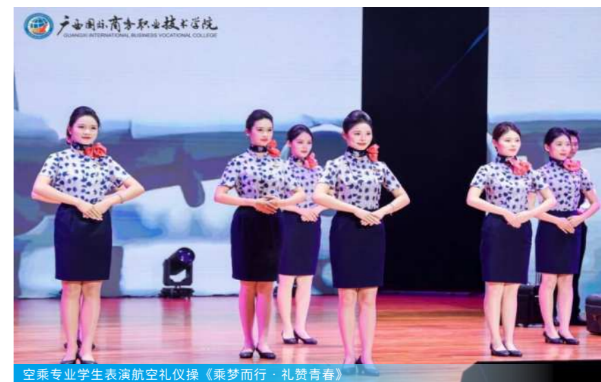
空乘专业学生表演航空礼仪操《乘梦而行·礼赞青春》

在校期间，学生既可以参加校内实训项目，也可以到企业进行实习实训，将理论知识与实际操作相结合，提高自身的职业素养。学校积极引导并大力支持学生参加各类职业技能竞赛，以赛促学，以赛促就，提高学生的专业技能水平和就业竞争力。