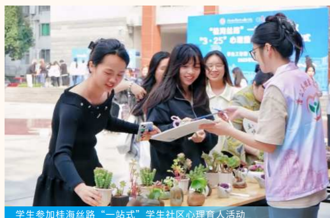
学生参加桂海丝路“一站式”学生社区心理育人活动