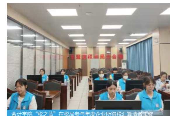
会计学院“税之蓝”在税局参与年度企业所得税汇算清缴工作

担任财务BP、数据分析师、供应链会计、电商运营会计、财税合规专员、ESG管理专员、数据评估师等。