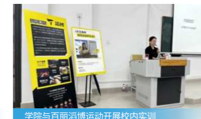
学院与百丽滔博运动开展校内实训