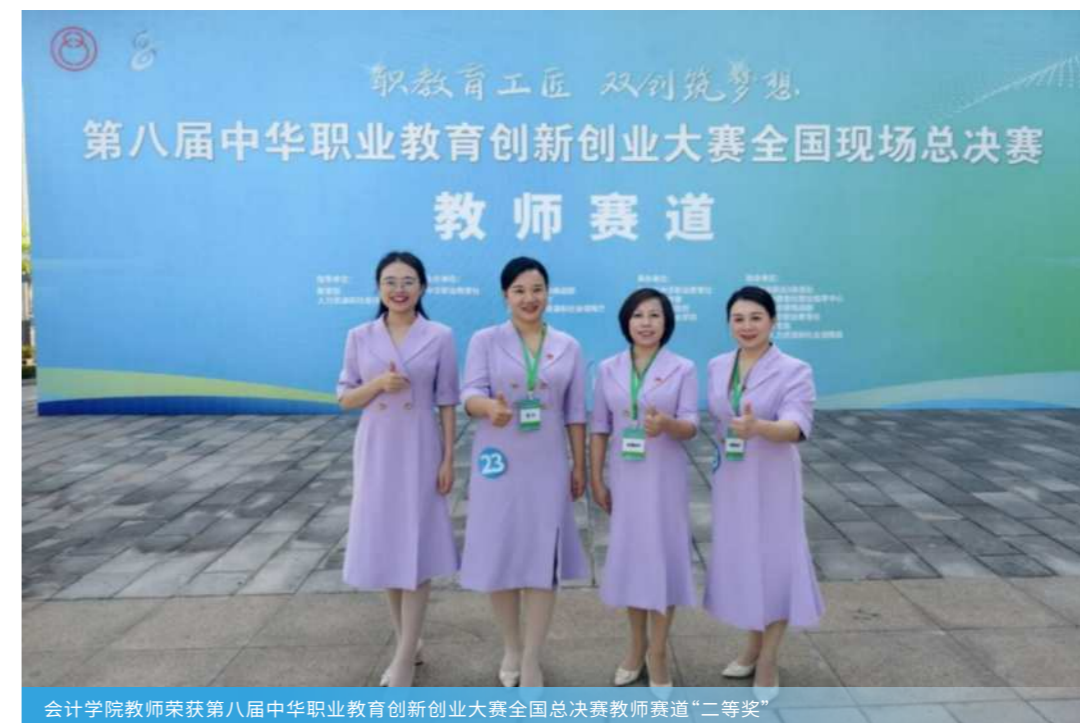
会计学院教师荣获第八届中国职业教育创新创业大赛全国总决赛教师赛道“二等奖”

智能会计核算、中小企业数字化代账、智能财税管理、跨境电商财税专员、财务BP、管理会计、供应链管理、财务数字化专员、财务数据分析师、RPA 财务机器人运维、智能审计等。