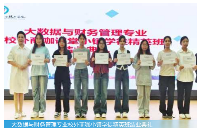
大数据与财务管理专业校外商咖小镇学徒精英班结业典礼