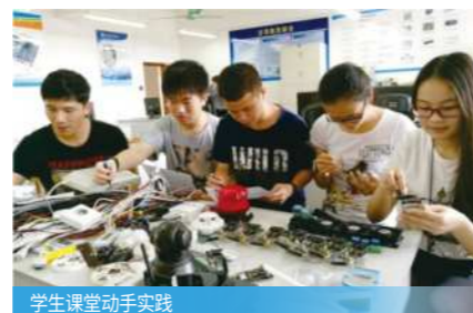
学生课堂动手实践