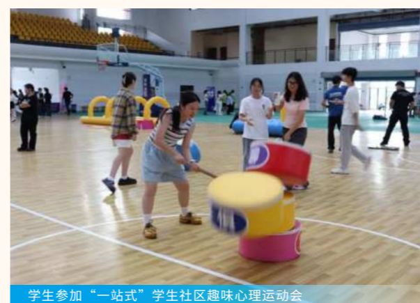
学生参加“一站式”学生社区趣味心理运动会