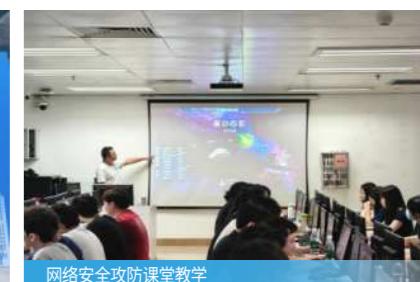
网络安全攻防课堂教学