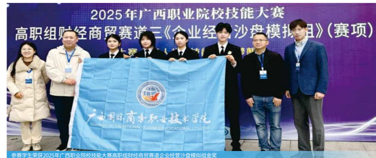
参赛学生荣获2025年广西职业院校技能大赛高职组财经商贸赛道企业经营沙盘模拟组金奖