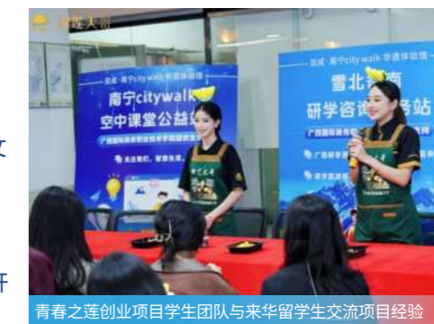
青春之莲创业项目学生团队与来华留学生交流项目经验

主要从事食品智能生产操作、工艺优化、质量管控、文旅食品开发、预制菜品牌运营、东盟跨境食品贸易等工作。