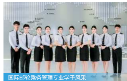
国际邮轮乘务管理专业学子风采