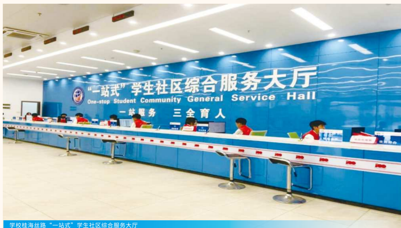
学校桂海丝路“一站式”学生社区综合服务大厅

学校坚持以学生为中心，不断满足学生身心成长需求，匠心打造富有中国—东盟商科职业教育特色的“桂海丝路”学生社区。2022年，学校成功入选教育部“一站式”学生社区综合管理模式建设自主试点单位；2023年，学校获评第二批全区高校“一站式”学生社区A类建设单位、第二批广西高校心理健康教育与咨询中心标准化A类建设单位。