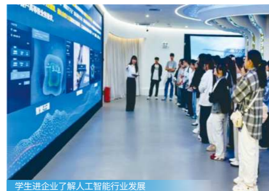
学生进企业了解人工智能行业发展

智能体研发、数据处理与标注、算法模型训练与测试、系统集成与运维、产品与技术支持、生成式 AI 应用等。