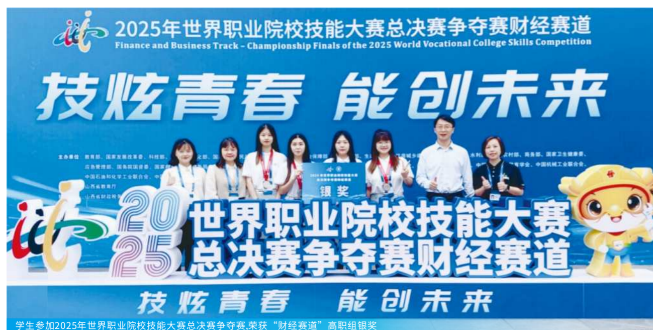
学生参加2025年世界职业院校技能大赛总决赛争夺赛,荣获“财经赛道”高职组银奖

学校始终牢记“为党育人、为国育才”的神圣使命。全校师生齐心协力，为学校“双高计划”建设及高质量发展不懈努力，成果显著。学生在各大赛项中实现历史性突破。