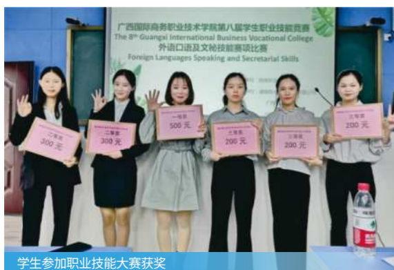
学生参加职业技能大赛获奖

国际贸易与商务、涉外旅游与服务、生产制造与管理。从事行业：外贸、生产制造、跨境电商、旅游等。