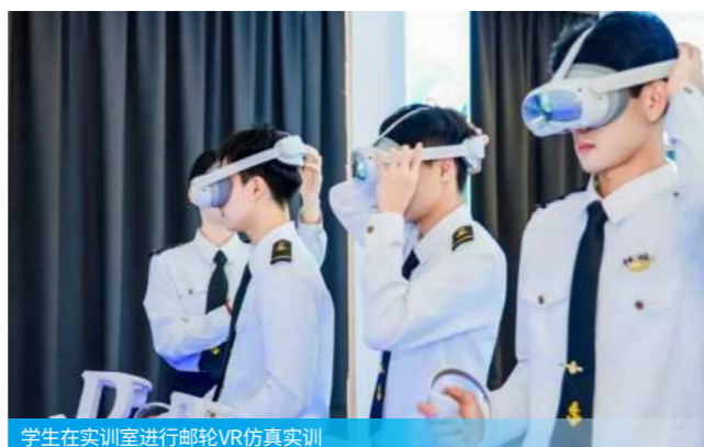
学生在实训室进行邮轮VR仿真实训