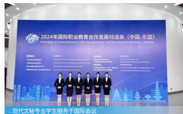
现代文秘专业学生服务于国际会议

秘书形象设计与礼仪、数字化办公技术、现代办公事务处理、会务管理、秘书写作、文书与档案管理、国际商务秘书、秘书职业概论、管理学基础、摄影摄像与短视频制作、新媒体编辑与运营、人力资源管理、Excel实用技术、现代商务信息技术与人工智能应用、商务综合英语等。