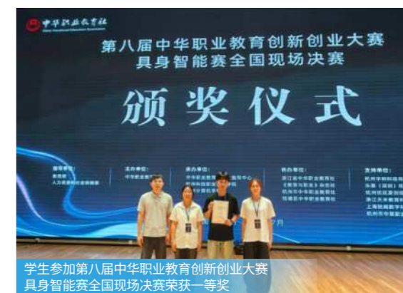
学生参加第八届中华职业教育创新创业大赛具身智能赛全国现场决赛荣获一等奖