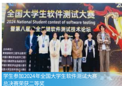
学生参加2024年全国大学生软件测试大赛总决赛荣获二等奖

全栈开发、Java 开发、Web 前端开发、小程序开发、软件测试、网站交互图像制作、低代码平台开发、数据库开发、信息系统维护、软件运维助理、软件文档编写等。