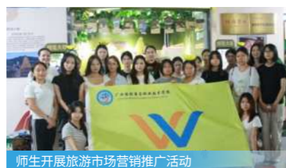
师生开展旅游市场营销推广活动