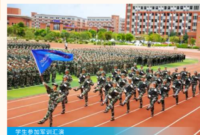
学生参加军训汇演