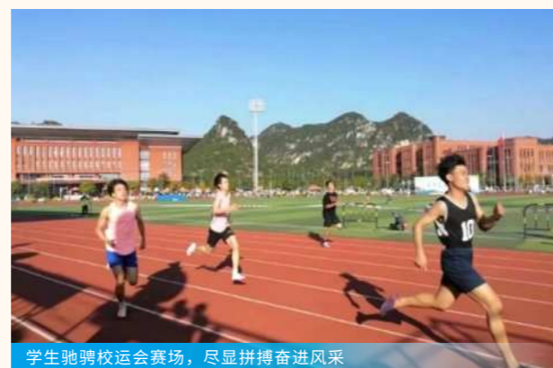
学生驰骋校运会赛场,尽显拼搏奋进风采