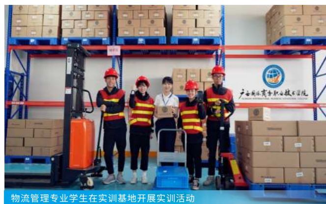
物流管理专业学生在实训基地开展实训活动

学校拥有中央财政支持实训基地3个，自治区示范性实训基地9个，自治区职业教育示范特色专业及实训基地5个，广西民族文化遗产创新职业教育基地1个，建有校内实训基地95个，校外实训基地139个。