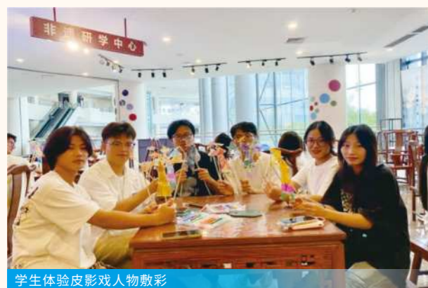
学生体验皮影戏人物敷彩