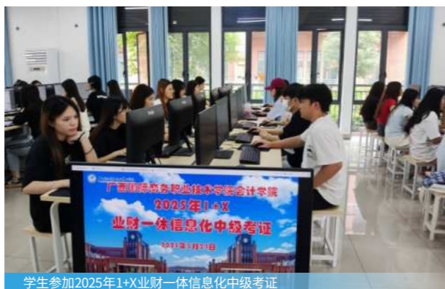
学生参加2025年1+X业财一体信息化中级考证