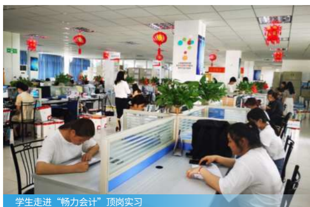
学生走进“畅力会计”顶岗实习

出纳、统计、会计核算、财务分析、成本管控、预算管理、绩效评价、财务规划、财税咨询、税务申报管理、财务风险管控、投融资管理、数据分析、数据评估等。