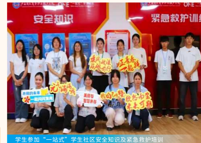
学生参加“一站式”学生社区安全知识和紧急救护培训