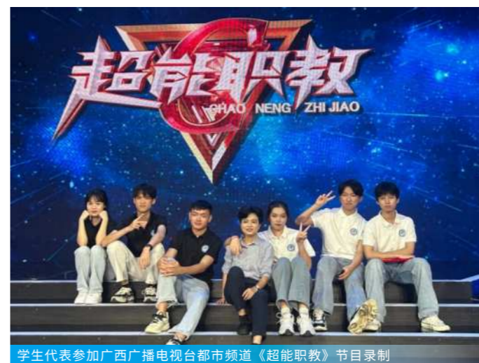
学生代表参加广西广播电视台都市频道《超能职教》节目录制