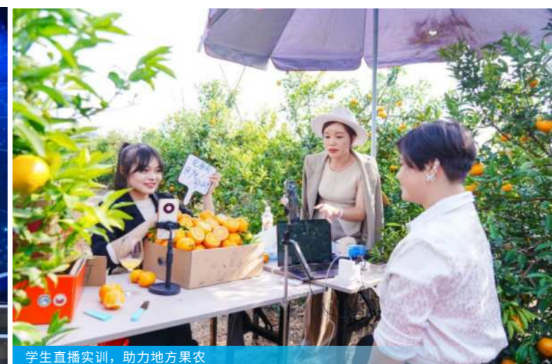
学生直播实训，助力地方果农