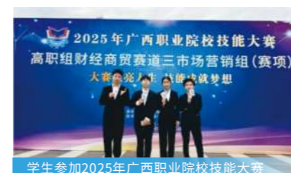
学生参加2025年广西职业院校技能大赛

主要从事市场数据分析与消费者行为洞察、数字营销策划与执行、智能客户运营管理及全域营销策略制定等工作，胜任互联网营销师、数字营销师、直播销售员、新媒体运营专员、市场调研专员、销售经理、客户服务主管工作等。