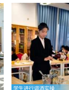
学生进行调酒实操