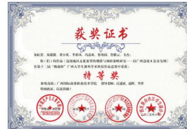
学生团队在第十二届“挑战杯”广西大学生课外学术科技作品竞赛中荣获特等奖

从事金融机构咨询、营销、客服等工作，胜任中小企业的财务管理、核心岗位为互联网金融运营管理、互联网金融数据分析、互联网金融产品设计与营销、信贷专员等岗位工作；发展岗位为商务数据分析师、高级客户经理、运营经理、理财经理、风险经理等。