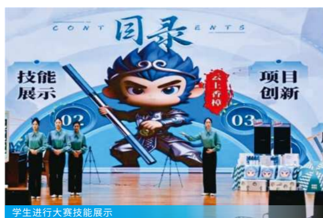
学生进行大赛技能展示