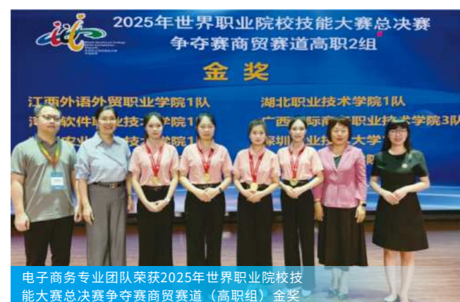
电子商务专业团队荣获2025年世界职业院校技能大赛总决赛争夺赛商贸赛道（高职组）金奖