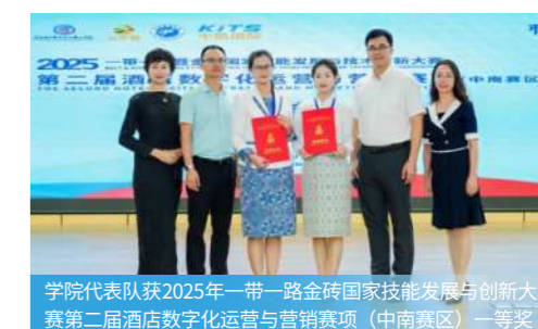
学院代表队获2025年一带一路金砖国家技能发展与创新大赛第二届酒店数字化运营与营销赛项（中南赛区）一等奖

在酒店管理公司、星级酒店、餐饮管理公司、民宿管理公司、会展中心、度假区等单位前厅、客房、餐饮、财务、俱乐部、人力资源、营销公关等部门从事行政管理、服务、督导、销售等工作，主要晋升岗位有店长、中高层管理领班、经理、区域总监、总经理等。