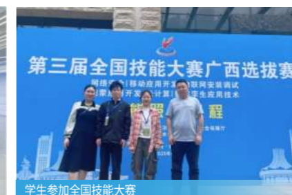
学生参加全国技能大赛