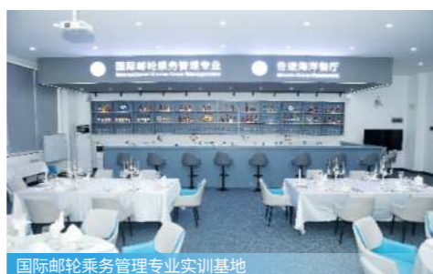
国际邮轮乘务管理专业实训基地