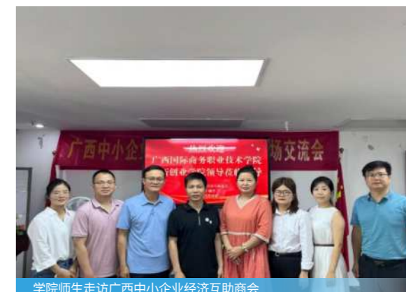
学院师生走访广西中小企业经济互助商会

担任自主创业或合伙创业的中小企业创业负责人、新媒体创业经营者、总经理助理、董事长秘书、企业咨询顾问、运营专员、策划专员、行政专员等。