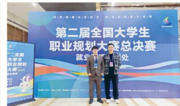
学生参加第二届全国大学生职业规划大赛总决赛荣获全国银奖

本专业为校企合作共建专业。除正常的人才培养工作外，企业根据用人需求为本专业学生定制特色课程和就业服务，另外自主收取职业技能培训费6500元/生，由学生根据个人情况自愿缴纳。