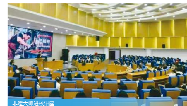
非遗大师进校讲座