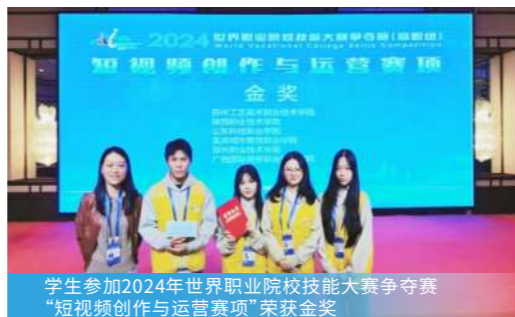
学生参加2024年世界职业院校技能大赛争夺赛“短视频创作与运营赛项”荣获金奖

专业特色：以“技术 + 内容 + 商务”为核心构建培养体系，本专业主攻短视频、直播、数据分析等新媒体技能，结合“桂果飘香”