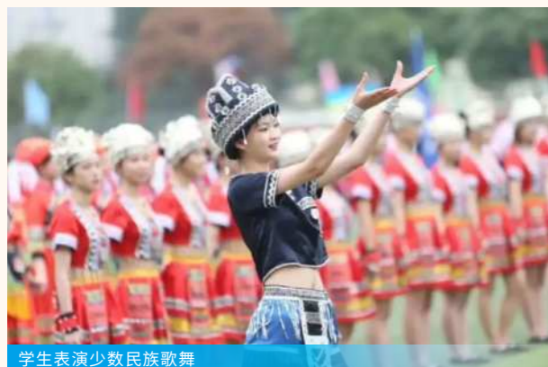
学生表演少数民族歌舞

为深入贯彻落实“三全育人”教育理念,全面促进学生德智体美劳五育并举、协同发展,学校以“以德铸魂、以智启慧、以体强身、以美育人、以劳筑基”为抓手,精心组织系列活动,引导广大学生在实践体验中锤炼品格、增长才干,切实提升综合素养。