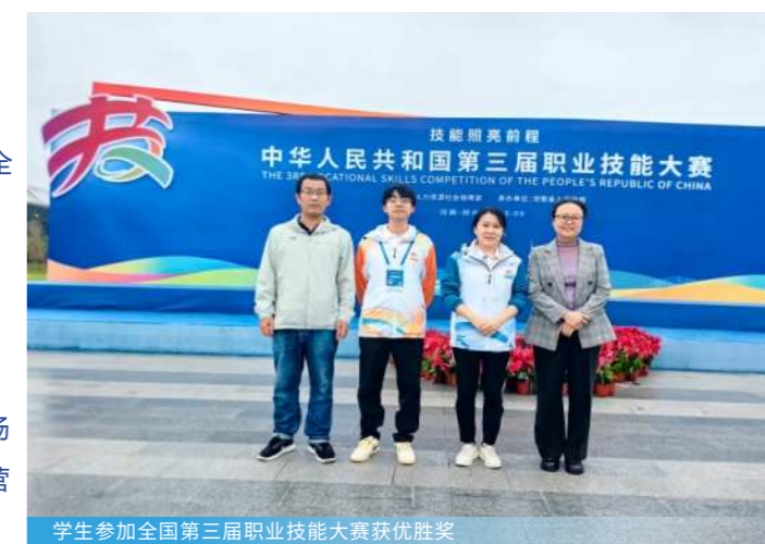
学生参加全国第三届职业技能大赛获优胜奖

毕业生可担任批发业和商务服务业的国际市场销售专员、营销专员、国际商务专员、跨境电商营销专员、国际采购专员、国际货运代理等。