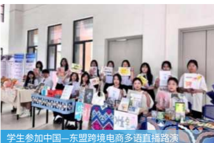
学生参加中国—东盟跨境电商多语直播路演