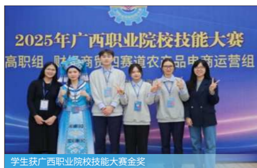
学生获广西职业院校技能大赛金奖

直播运营、主播、网销客服、互联网运营、网络营销活动策划与推广、新媒体运营、直播运营、短视频运营、网络自主创业等。