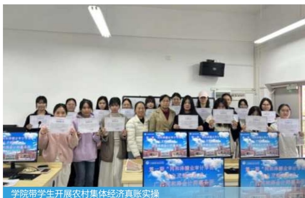
学院带学生开展农村集体经济真账实操

财务审计、内部审计、大数据审计分析、ESG审计、税务审计、融资审计、合规审查、企业内部控制与风险管理、数据安全审计、制造业内控审计等。