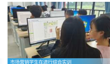
市场营销学生在进行综合实训