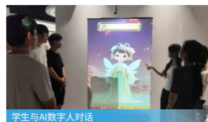
学生与AI数字人对话