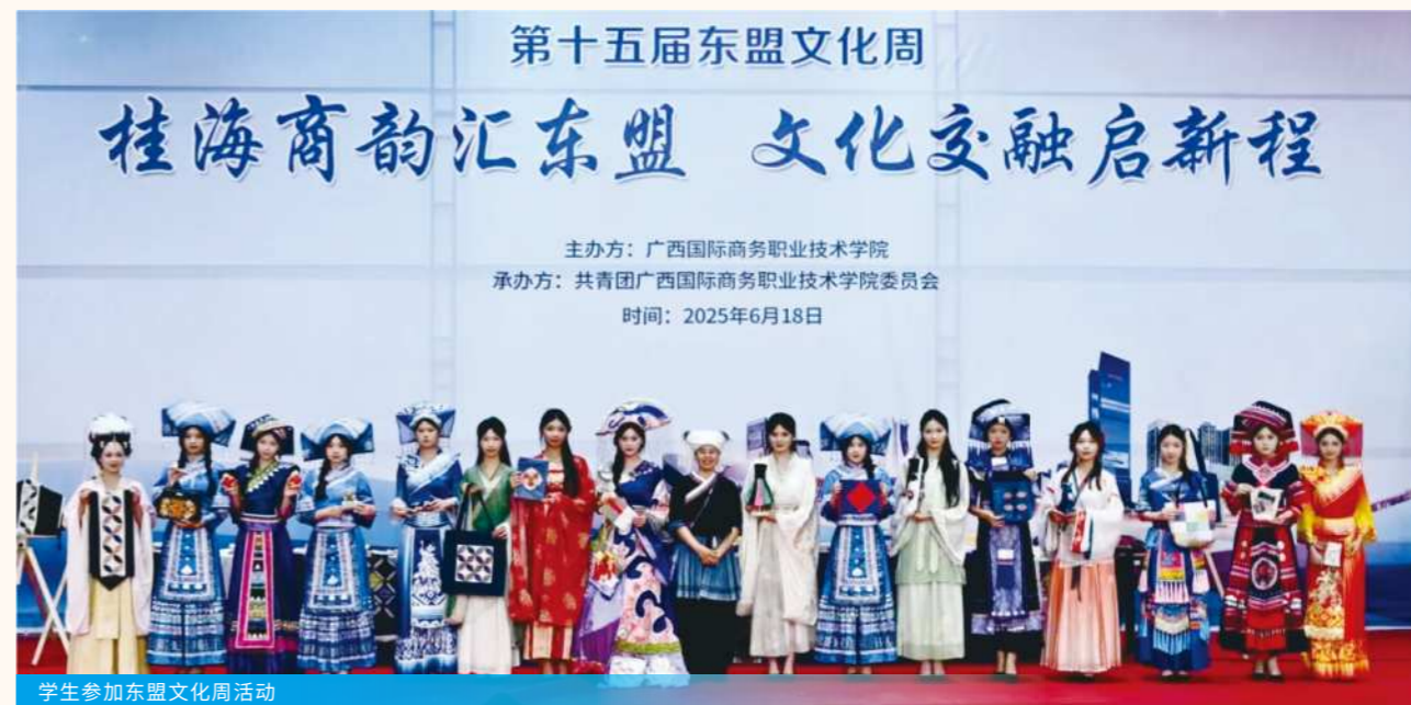
学生参加东盟文化周活动