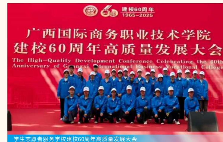
学生志愿者服务学校建校60周年高质量发展大会