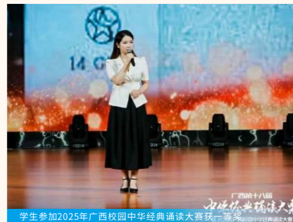
学生参加2025年广西校园中华经典诵读大赛获一等奖