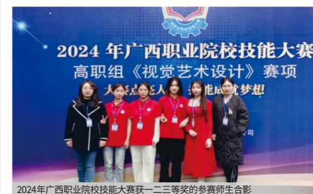
2024年广西职业院校技能大赛获一、二、三等奖的参赛师生合影