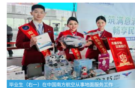
毕业生（右一）在中国南方航空从事地面服务工作