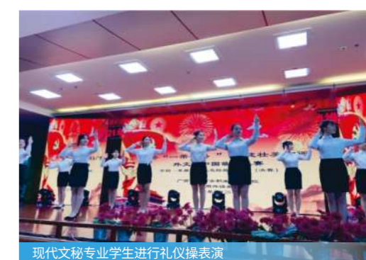
现代文秘专业学生进行礼仪操表演