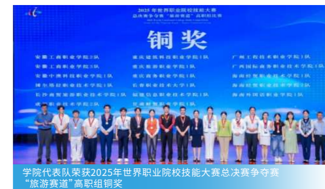
学院代表队荣获2025年世界职业院校技能大赛总决赛争夺赛“旅游赛道”高职组铜奖

胜任旅游行政管理部门办公室综合岗、旅游推广与活动辅助、旅游媒体短视频内容与直播运营等工作。担任外事部门国际旅游合作专员、领事随员，主题乐园VIP导览员、娱乐设施运营师、客流控制员，旅行社旅行定制师、导游，研学旅行指导师，旅游电商企业产品运营师、用户体验助理、私域流量运营专员，文博馆讲解员，研学旅行指导师(文博方向),文创产品开发与销售助理，旅游度假区及高星级度假村体验策划师、大型会议协调员、宾客关系专员，新媒体运营专员，旅拍摄影公司旅拍定制师、目的地场景策划师等。