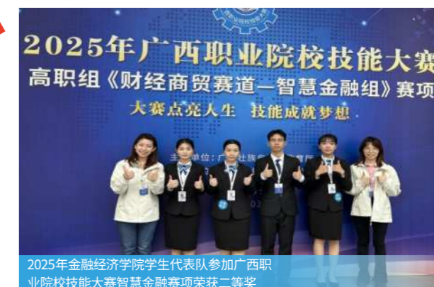
2025年金融经济学院学生代表队参加广西职业院校技能大赛智慧金融赛项荣获二等奖

胜任银行、证券、基金及保险等金融机构以及其他金融服务类企业的综合柜员、客户经理、理财经理、资产保全、信用管理等专业岗位工作；在各类中小型企业，从事投融资服务、资产运营管理、生产和经营活动；胜任国际贸易融资等专业岗位工作。