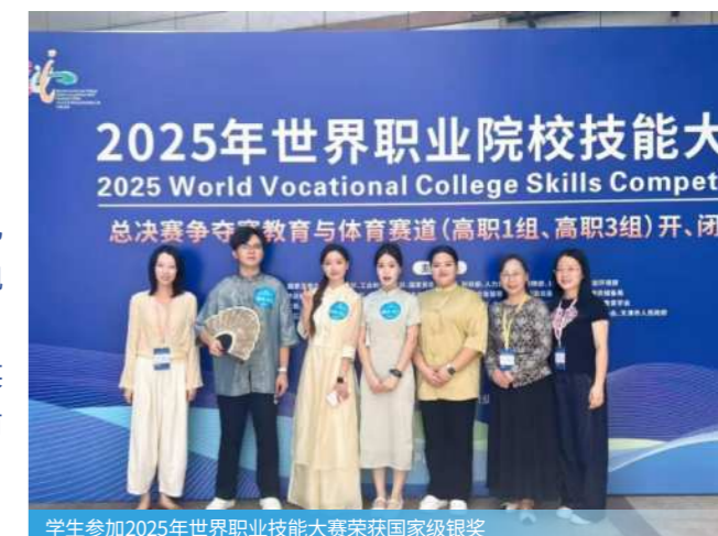
学生参加2025年世界职业技能大赛荣获国家级银奖

主干课程： 商务综合英语、商务英语口语、商务英语翻译、跨文化交际、涉外商务接待与谈判、跨境电商英语、商务英语函电、国际贸易实务等。