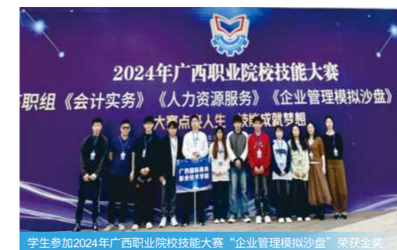
学生参加2024年广西职业院校技能大赛“企业管理模拟沙盘”荣获金奖