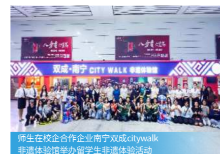
师生在校企合作企业南宁双成citywalk非遗体验馆举办留学生非遗体验活动