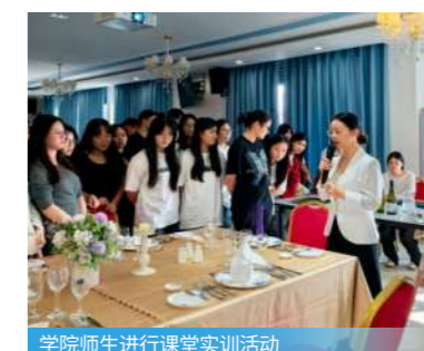
学院师生进行课堂实训活动