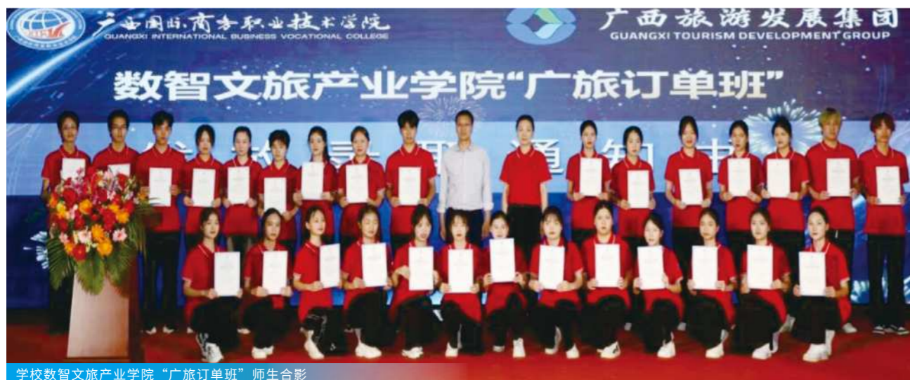
学校数智文旅产业学院“广旅订单班”师生合影