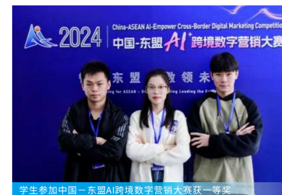
学生参加中国—东盟AI跨境数字营销大赛获一等奖

本专业与广西启迪创新跨境电子商务有限公司合作，联合共建广西首个“园园一体”的跨境电商产业学院，学生第二年在南宁综合保税物流园区学习，在校企高水平双导师带领下开展跨境电商运营、物流、跨境电商直播等产业前端的零距离实践。