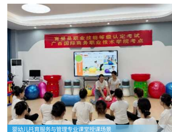
婴幼儿托育服务与管理专业课堂授课场景

在幼儿园、幼托机构、早教机构、感统训练机构、儿童康复机构、母婴护理机构，担任托育教师、感统训练师、儿童康复师、育婴员等。