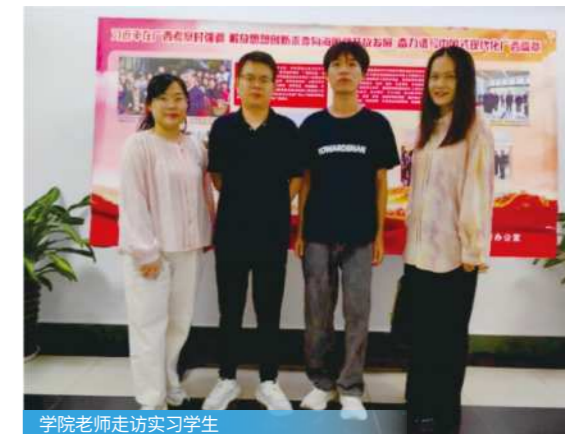
学院老师走访实习学生

担任大数据开发工程师、数据分析师、数据运维工程师，在互联网公司、金融科技公司、智能制造企业，参与数据平台搭建、商业智能分析、精准运营等领域工作，适配企业数字化转型刚需。