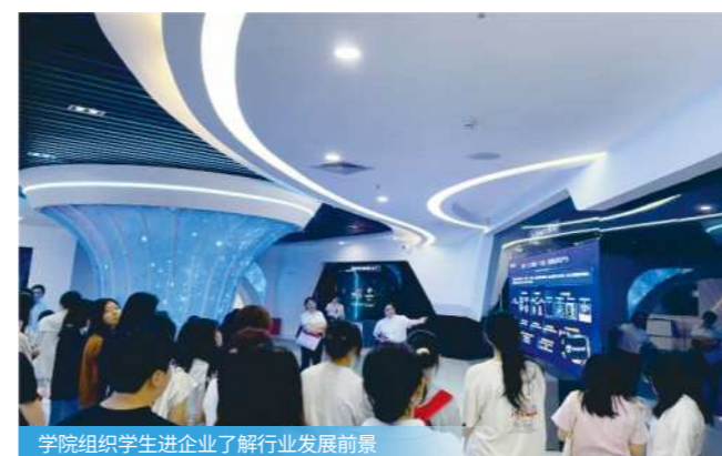
学院组织学生进企业了解行业发展前景