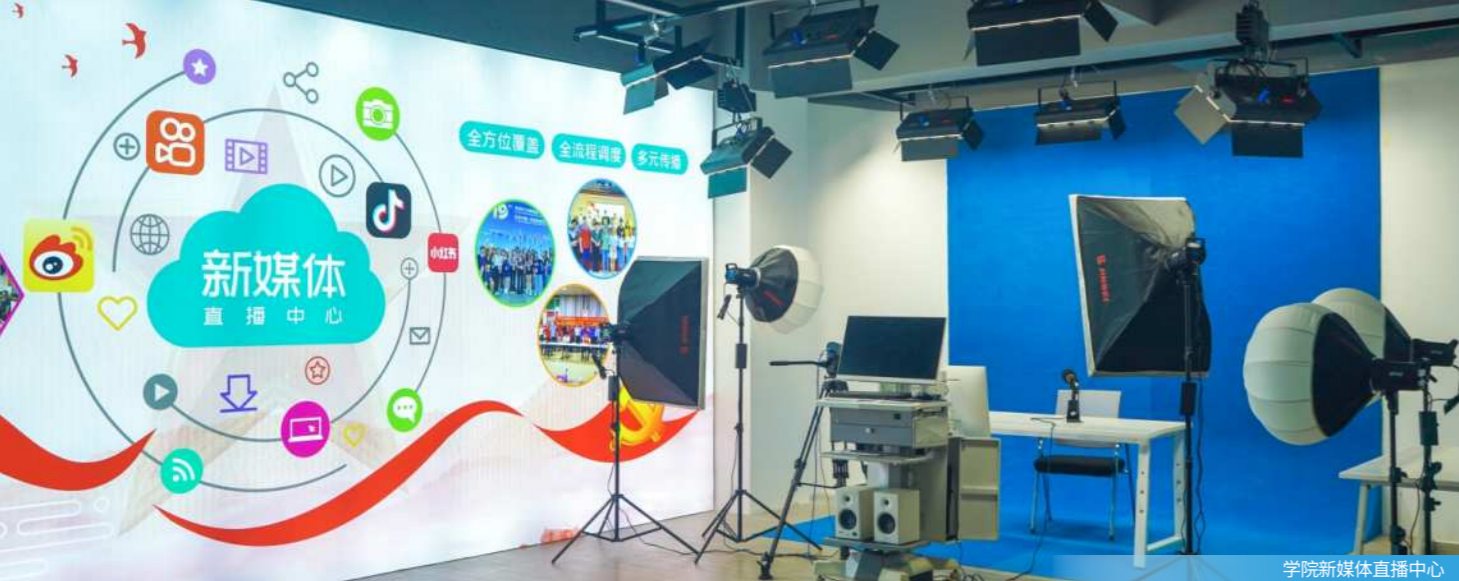
学院新媒体直播中心