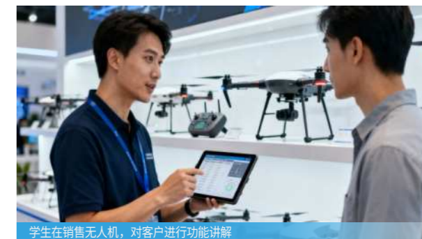
学生在销售无人机，对客户进行功能讲解