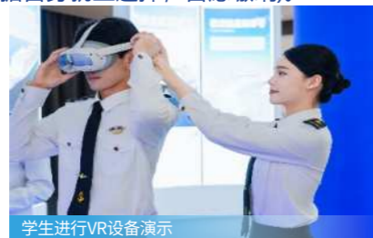
学生进行VR设备演示