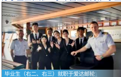
毕业生（右二、右三）就职于爱达邮轮