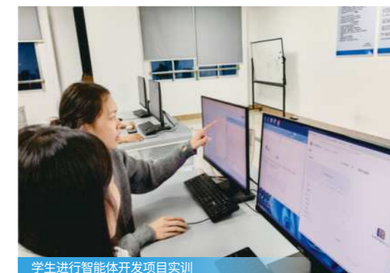
学生进行智能体开发项目实训