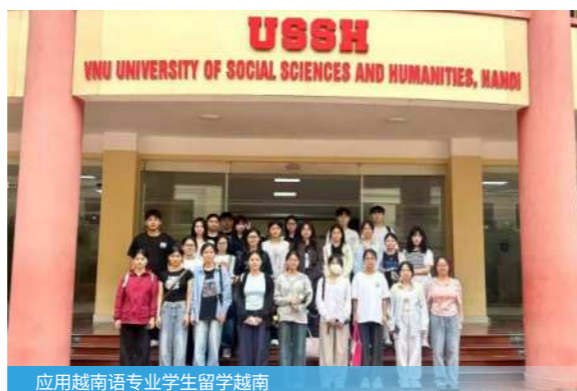
应用越南语专业学生留学越南