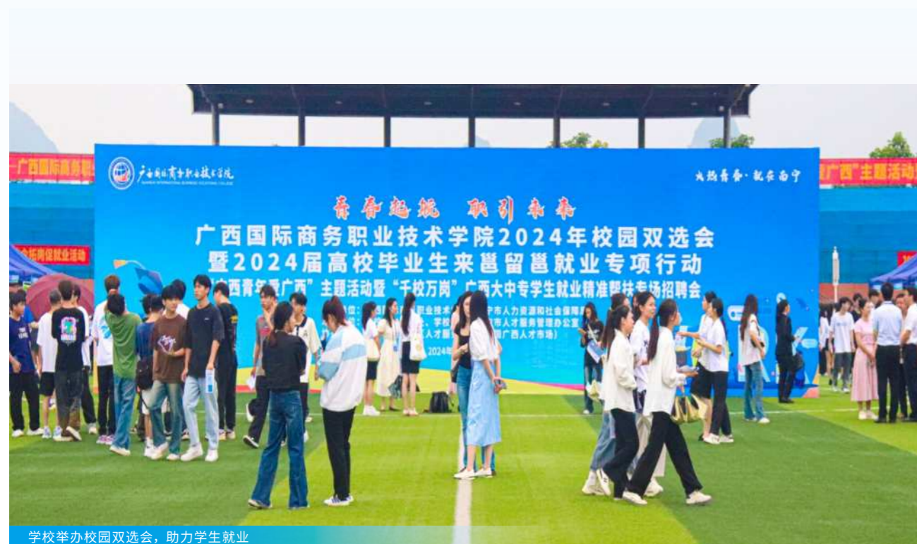
学校举办校园双选会，助力学生就业

学校毕业生初次去向落实率持续稳定在90%以上，就业质量与口碑双优！先后获教育部“全国毕业生就业典型经验高校”、“全国高校毕业生就业能力培训基地”，获自治区党委、自治区人民政府授予“第一届广西促进就业先进集体”称号，连续22年被评为“全区高校就业创业工作先进单位”。同时，学校专业群紧密对接行业企业发展的新趋势，致力于满足学生多样化的发展需求，为学生打造了优质的就业前景。