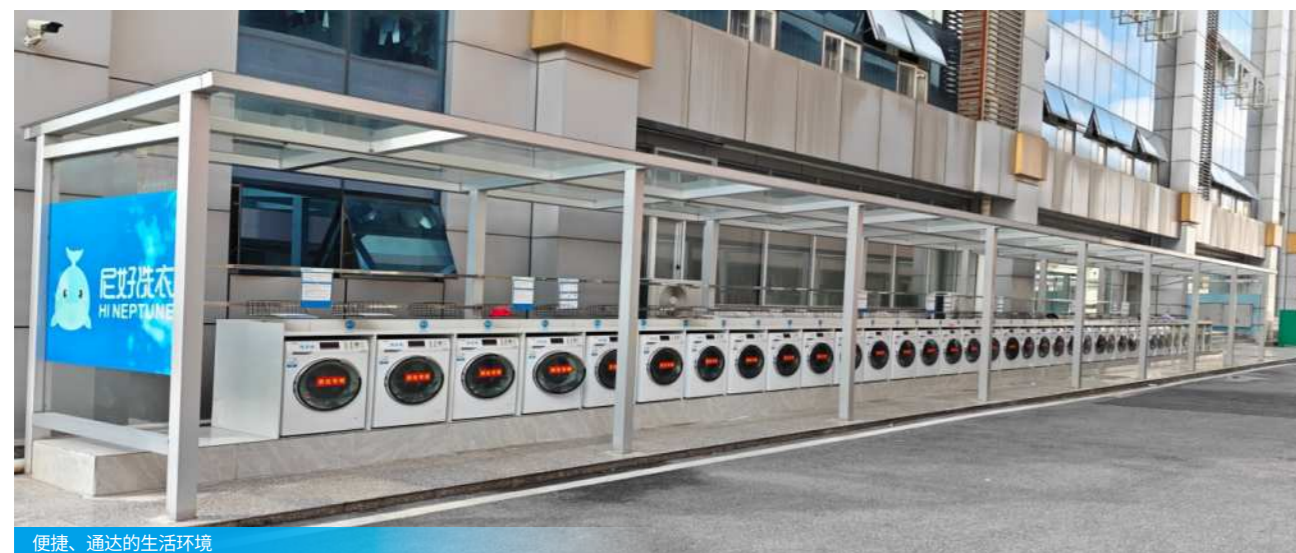
便捷、通达的生活环境