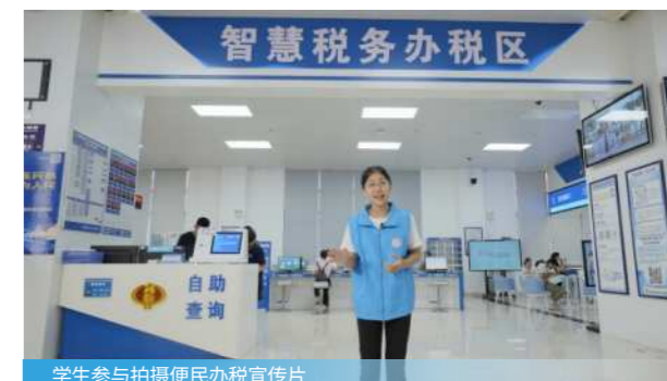
学生参与拍摄便民办税宣传片

企业财务会计、纳税实务、统计基础、审计基础、税务会计、纳税检查、大数据技术在财务中的应用、涉外税制与实务、会计信息系统应用、纳税申报实训、Excel在财务中的应用、财税合规与管控、Python在财税中的应用、税收风控、东盟税制。