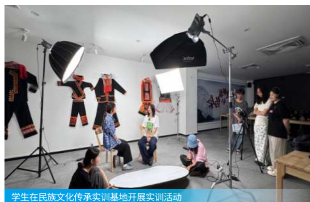
学生在民族文化遗产实训基地开展实训活动

学校拥有中央财政支持实训基地3个，自治区示范性实训基地9个，自治区职业教育示范特色专业及实训基地5个，广西民族文化遗产创新职业教育基地1个，建有校内实训基地95个，校外实训基地139个。