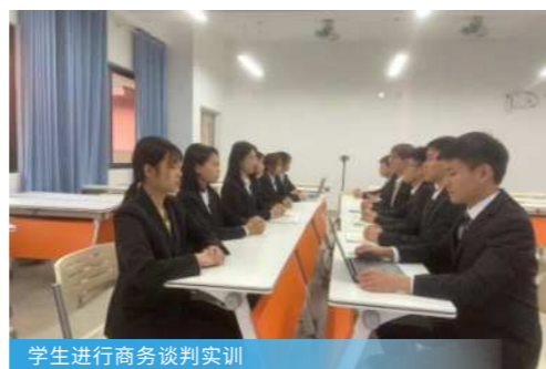
学生进行商务谈判实训

主要是在外资企业、跨国公司、国际金融机构、工贸公司、商贸公司、科贸公司、货物进出口公司、国际国内融资企业、银行、保险公司、财务公司等单位就职。胜任商务专员、管理培训员、管理信息助理、会计主管、销售主管工作等。