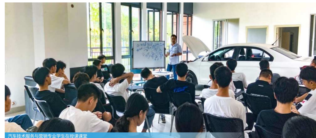
汽车技术服务与营销专业学生在授课课堂

本专业为校企共建专业，全部专业课程均由企业老师进行授课，企业根据市场需求为本专业制定三年特色课程并提供对口实习岗位推荐。