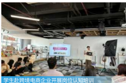
学生赴跨境电商企业开展岗位认知培训