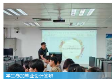
学生参加毕业设计答辩