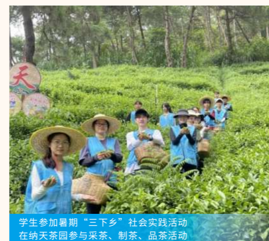
学生参加暑期“三下乡”社会实践活动 在纳天茶园参与采茶、制茶、品茶活动

我校206名共青团员、学生志愿者以饱满的热情和专业的服务精神，圆满完成2025年第22届中国—东盟博览会及峰会志愿服务工作，为盛会的顺利举办贡献了青春力量。