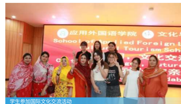
学生参加国际文化交流活动

主要面向涉外商贸服务行业，可担任商务助理、行政助理、跨境电商运营专员、翻译及涉外文秘等。