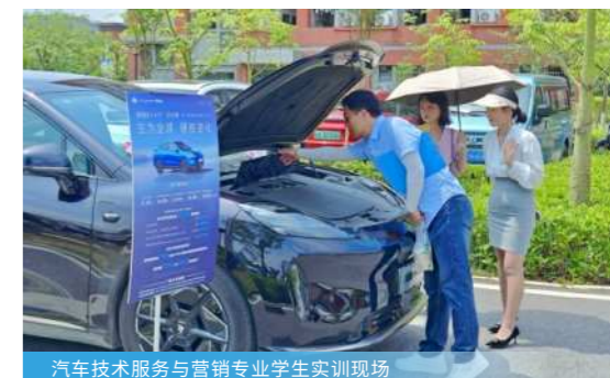
汽车技术服务与营销专业学生实训现场

担任汽车销售顾问、二手车评估鉴定师、汽车客户服务专员、汽车检测专员、汽车保险理赔专员等。