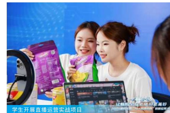
学生开展直播运营实战项目