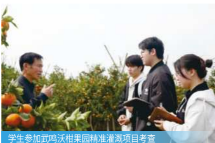
学生参加武鸣沃柑果园精准灌溉项目考查