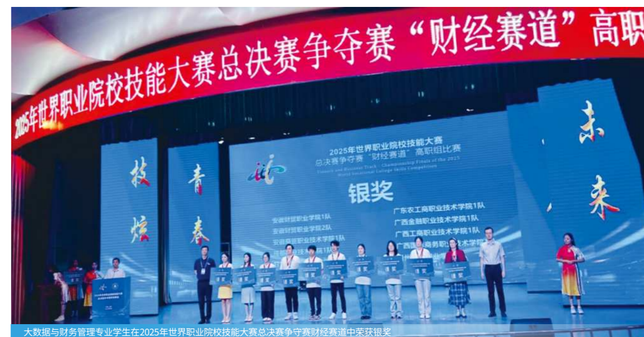
大数据与财务管理专业学生在2025年世界职业院校技能大赛总决赛争夺赛财经赛道中荣获银奖