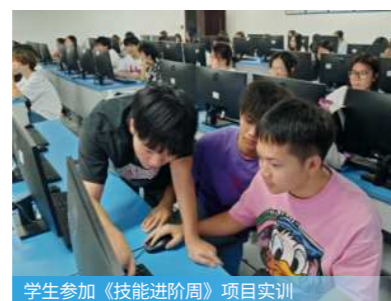
学生参加《技能进阶周》项目实训