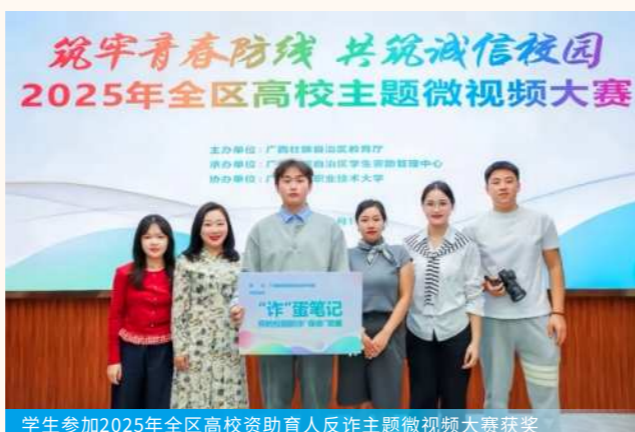
学生参加2025年全区高校资助育人反诈主题微视频大赛获奖