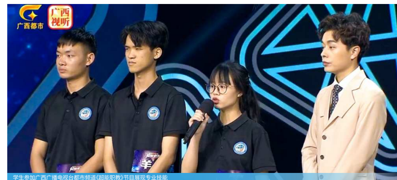
学生参加广西广播电视台都市频道《超能职教》节目展现专业技能