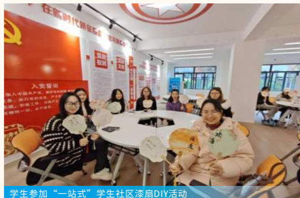
学生参加“一站式”学生社区漆扇DIY活动