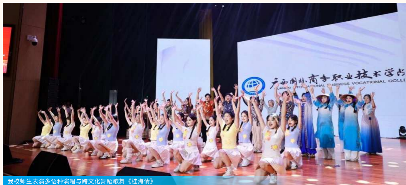
我校师生表演多语种演唱与跨文化舞蹈歌舞《桂海情》

为深入贯彻落实“三全育人”教育理念,全面促进学生德智体美劳五育并举、协同发展,学校以“以德铸魂、以智启慧、以体强身、以美育人、以劳筑基”为抓手,精心组织系列活动,引导广大学生在实践体验中锤炼品格、增长才干,切实提升综合素养。